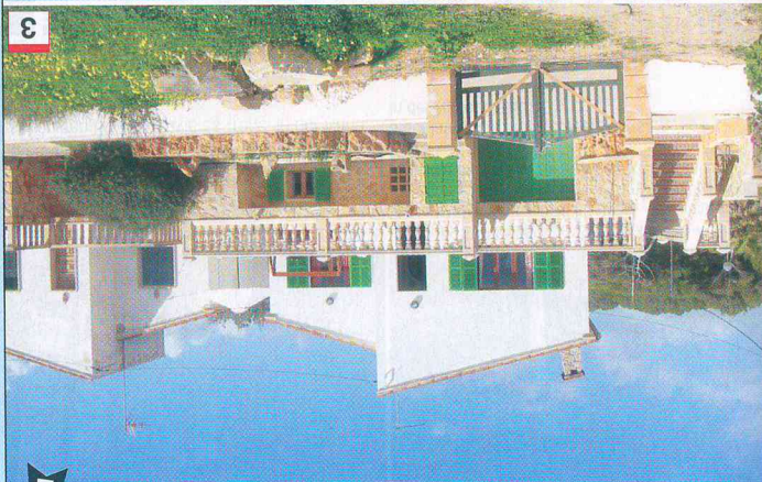
EML536 - Es Trenc

Diese Landfinca liegt nur wenige Kilometer von den schönsten und größten Strandparadiesen entfernt. Es Trenc und Sa Rapita haben echte Karibik-Qualität und erstrecken sich über eine Länge von mehreren Kilometern. Der 4000 m 2 große und eingezäunte Garten mit großzügigem Pool liegt innerhalb eines enormen Landgutes, welches noch bewirtschaftet wird. Alle 7 Doppelzimmer verfügen über ein eigenes Bad, Klimaanlage und Satelliten-TV. Auf Wunsch und Bestellung (mindestens 2 Wochen vor Anreise) 2 Zustell- und 3 Babybetten. Durch eine Verbindungstür erreichen Sie ein einfacheres Apartment mit 3 Doppelzimmern (3 Betten von 135 x 180 cm) und einem Bad. Im Apartment steht eine Klimaanlage zur Verfügung.