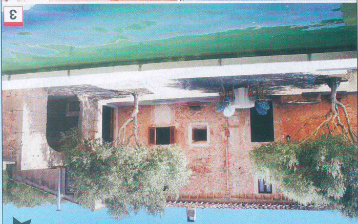
EML613 - Sa Rapita

mit herrlichem Meerblick zum Entspannen. Für Goffer ist der Club „SON ANTEW“ gut gelegen. ca. 20 Autominuten entfernt.