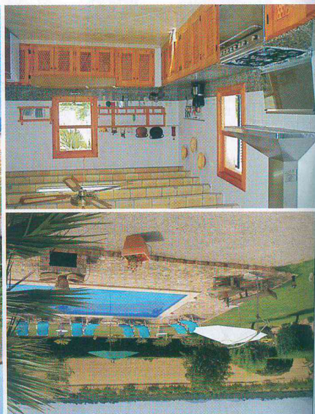
EML515 - Es Trenc